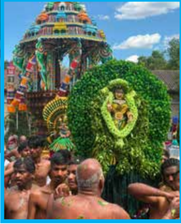
சுவிட்ஸர்லாந்து ஸ்ரீ மனோன்மணி அம்பாள் ஆலய தேர்த்திருவிழா கடந்த ஞாயிற்றுக்கிழமை நடைபெற்றது.