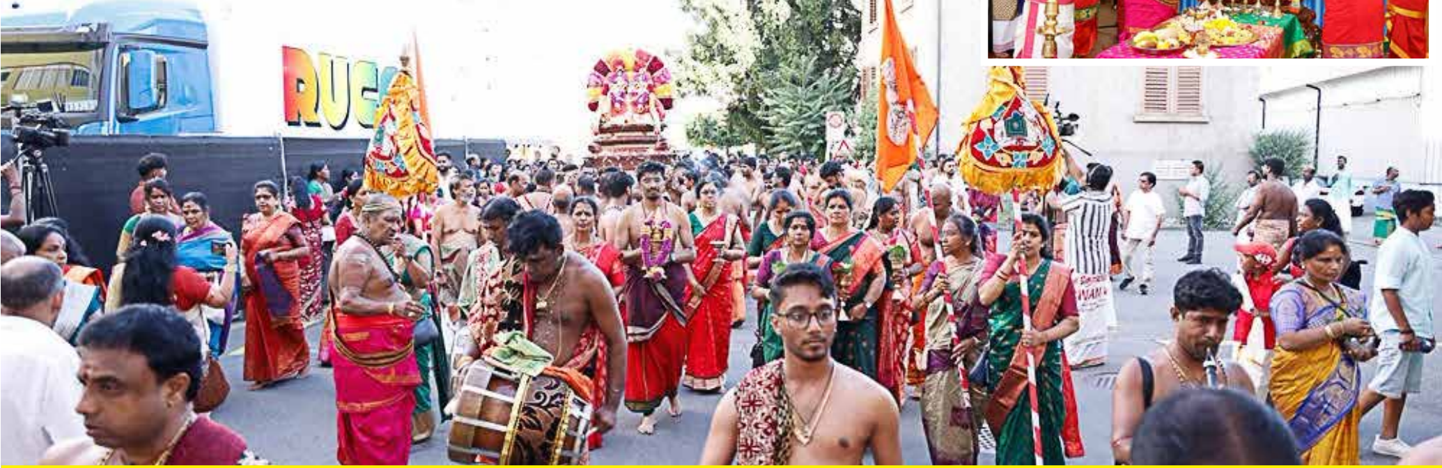
அருள்மிகு சிவன் கோவில் சைவத்தமிழ்ச்சங்கம் 27.6.2026 சனிக்கிழமை மகோற்சவ திருவிழா ஒன்பதாம் நாள் பகல் தோத்திருவிழா சிறப்பு பூசை வழிபாடுகள்.