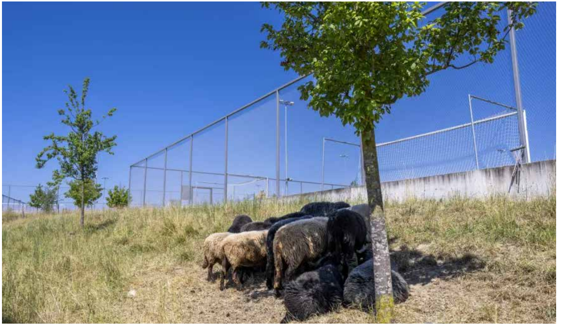
சுவிட்சர்லாந்தில் கடுமையான வெப்பம் காரணமாக கால் நடைகள் வெப்பத்தை தணிக்க சிறிய மரத்தின் கீழ் கூட்டமாக...